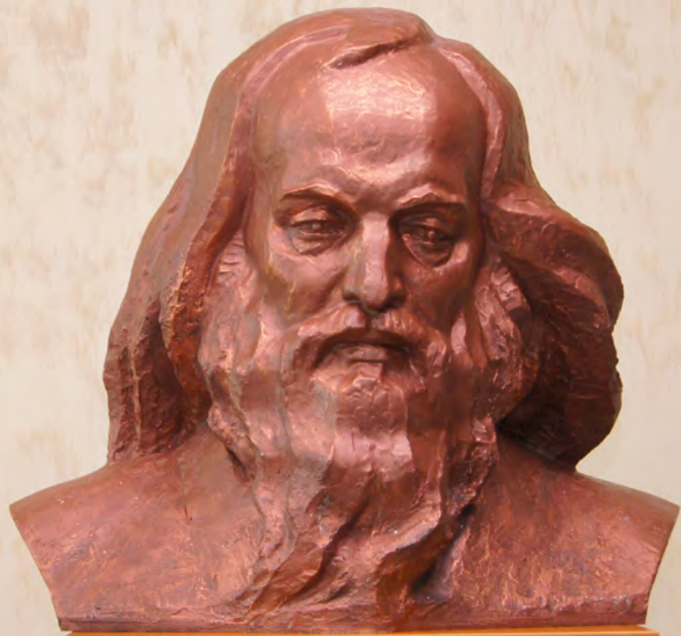
Бюст Д. И. Менделеева

Тюменская областная научная библиотека имени Д. И. Менделеева