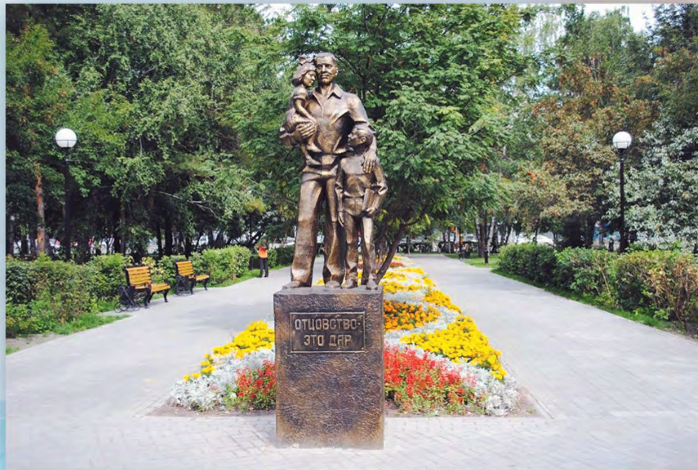
Скульптура «Отцовство – это дар»